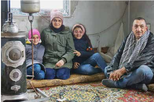
Sicherer und beheizbarer Wohnraum für Familien

Die Diakonie Katastrophenhilfe leistet seit 2012 in Syrien und den Nachbarländern humanitäre Hilfe. Mit unseren Partnern vor Ort konnten wir seither schon über 1,3 Millionen Menschen helfen. Auch 2021 sind wir weiterhin in vielen Regionen Syriens aktiv , um das Überleben von besonders bedürftigen Menschen zu sichern und neue Lebensgrundlagen für sie zu schaffen. Neben der Verteilung von Lebensmitteln, Hygieneartikeln und Winterkleidung unterstützen wir die Instandsetzung von Wohnraum , damit vertriebene Familien wieder ein sicheres Zuhause finden. Zudem setzen wir kleinere Geschäfte wieder instand und unterstützen Menschen dabei, sich mit Handel oder Dienstleistungen ein eigenes Einkommen zu erwirtschaften .