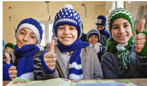
Winterhilfe: Wärmende Kleidung für Kinder

Wussten Sie, dass allein in Syrien noch immer 11 Millionen Menschen humanitäre Hilfe benötigen? Besonders schwierig ist die Lage für die über 6 Millionen Menschen, die im eigenen Land fliehen mussten. Sie leben oftmals unter katastrophalen Zuständen in völlig überfüllten Vertriebenen-Camps, in Bauruinen oder in zerstörten Häusern. Immer häufiger wird von schweren Erkrankungen berichtet, die für die Schwächsten lebensbe-